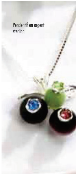
Pendentif en argent sterling