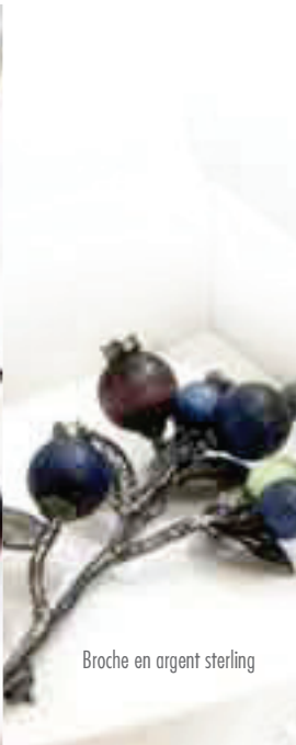
Broche en argent sterling