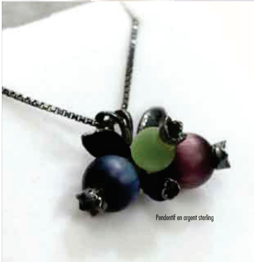
Pendentif en argent sterling